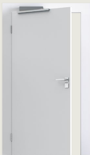
2. Karmmontage på gångjärnssidan