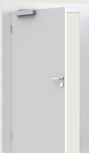
1. Dörrbladsmontage på gångjärnssidan