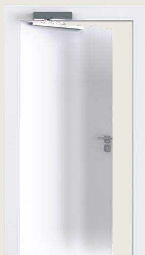
3. Karmmontage på anslagssidan