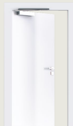
4. Dörrbladsmontage på anslagssidan